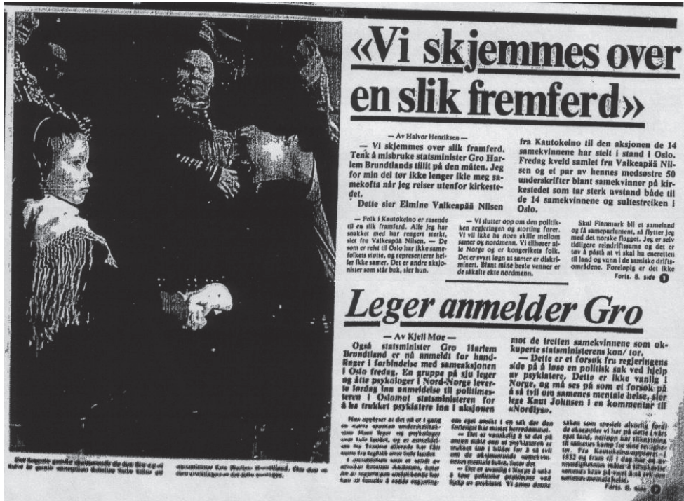
Nordlys førstesideoppslag 9.2.1981

Politiet har i norske nyhetsmedier både hatt en sentral plass som kilde, og også blitt framstilt gjennomgående positivt både i tidligere tider og i dag og tallene var neppe særlig mye annerledes rundt 1980. Politiet som kilde til nyheter har likevel vært et noe problematisk felt i journalistikken. Samarbeidet mellom politi og journalister kan bli for tett og ukritisk (HiO, kursbeskrivelse i retts- og kriminalitetsjournalistikk 2002). Situasjonen var neppe særlig annerledes rundt 1980, noe som kan forklare journalistenes få kritiske spørsmål til politiet under Alta-kampen.