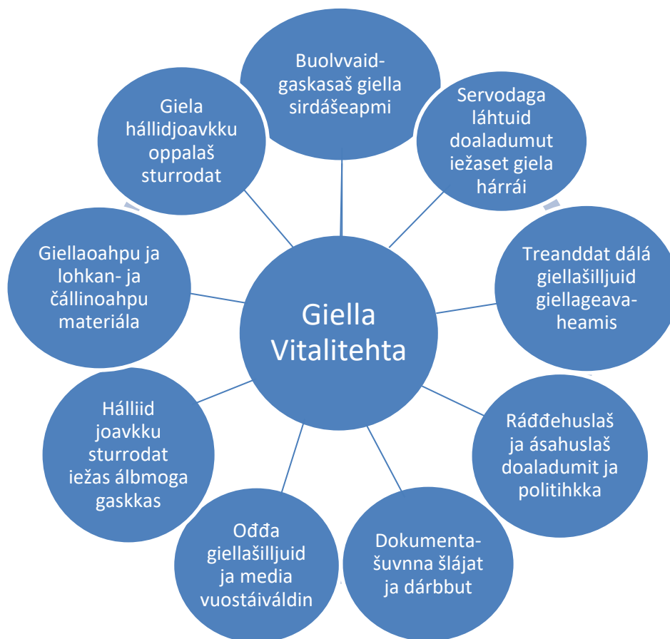
Govva 4.5: UNESCO áitojuvvon gielaide árvoštallan fáktorat. Gáldu: UNESCO 2003. Sámás: Rasmussen 2013: 23.

Unesco uhkiduvvon gielaide listtus lea davvisámegiella merkejuvvon čielgasit áitojuvvon (definitely endangered) giellan.