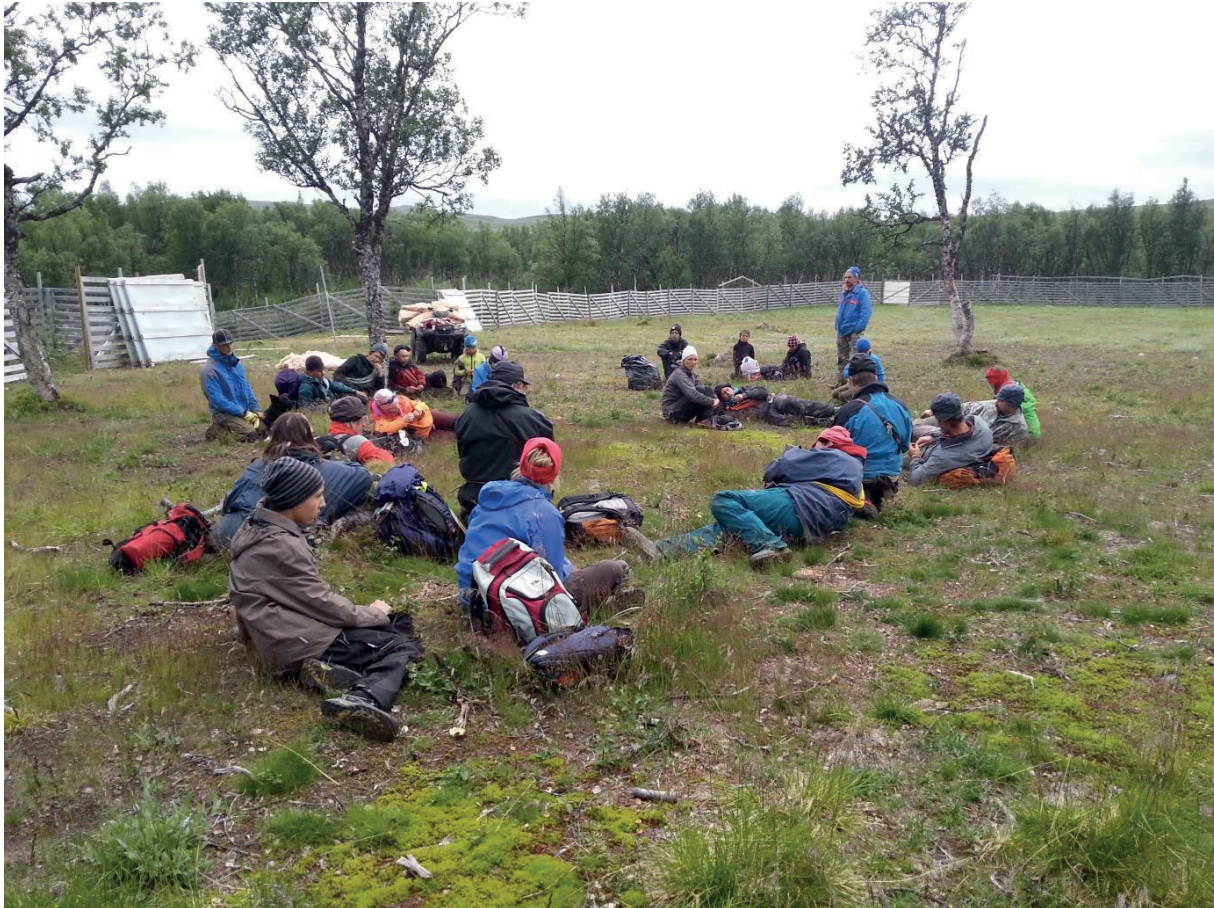
Samebyen har gitt tillatelse til publisering.